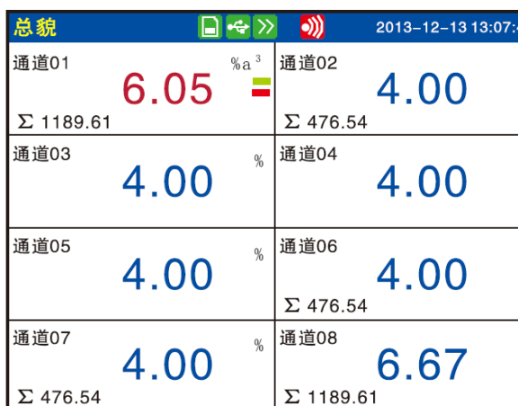
— 数字显示 —